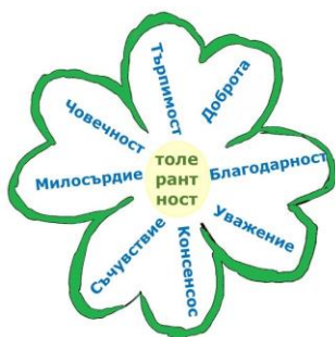
Фигура 1. Концепция за толерантност

В групата, учениците трябва в рамките на 15 мин. да дискутират „как да се противопоставим на дискриминацията“, „какво е необходимо за да си толерантен“, „какво е толерантност“ и да попълнят фигура 1. на приложение 1. с добродетели, които според тях включва концепцията за толерантност.